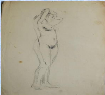
“Nudo” skicë e viteve 1951-1957.