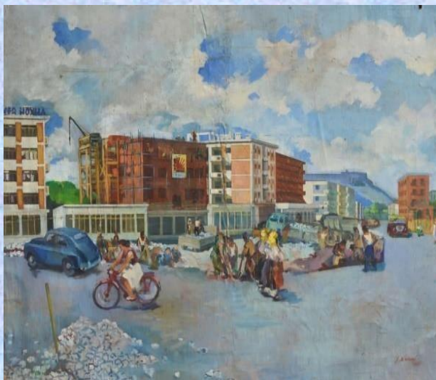
“Shkodra”, viti 1966 ( Koleksion familjar)