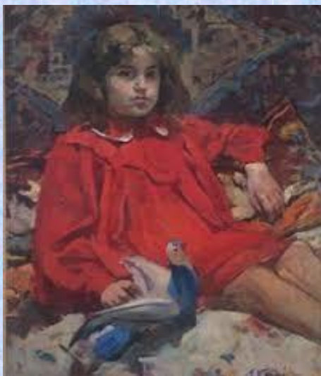
‘‘Vajza me pëllumb’’ (GKA-Shkodër)