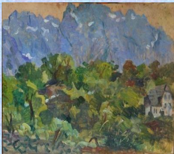
“Thethi” ( Koleksion familjar)