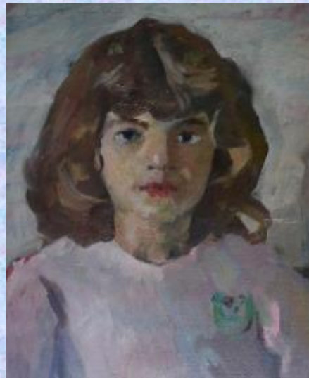
‘‘Autoportret’’ (GKA- Tiranë)