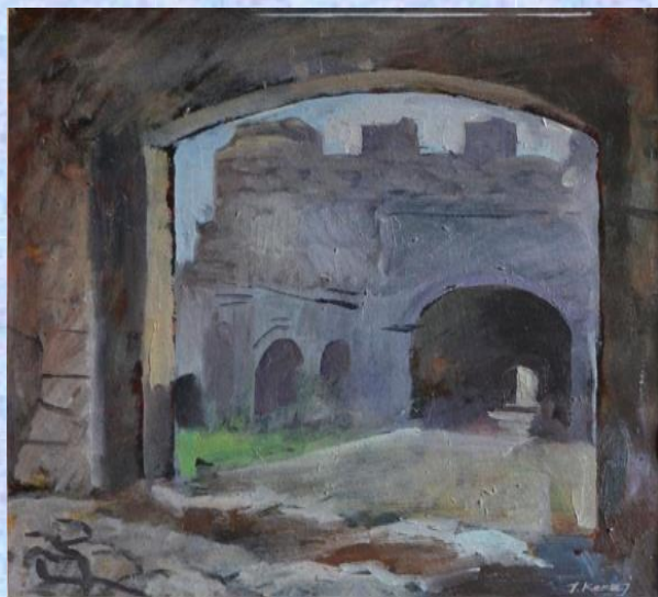
“Porta e kalasë”